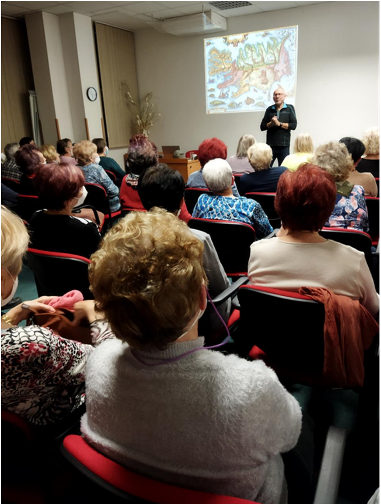
Akademie třetího věku Kolem světa