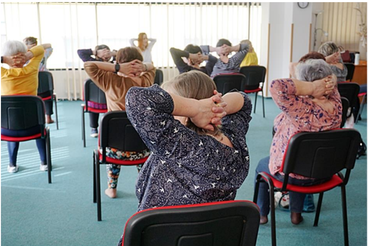
Jóga na židlích