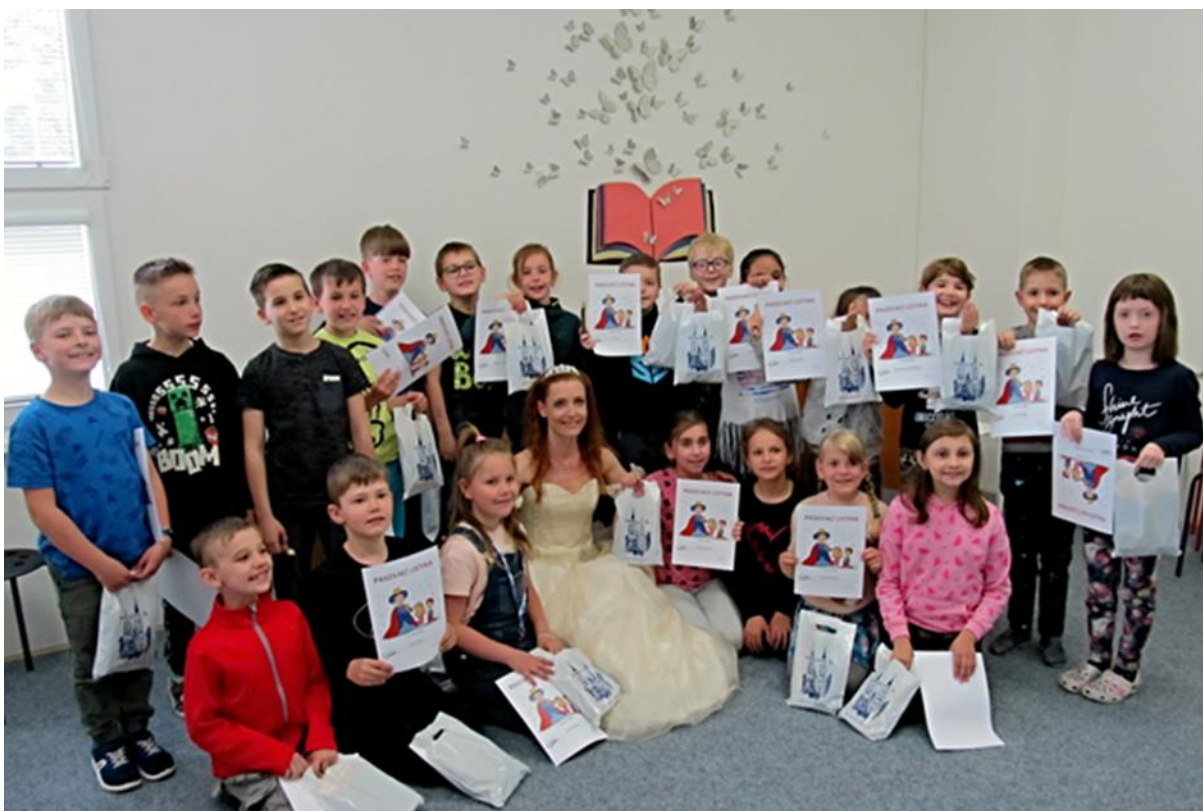
Pasování na čtenáře ZŠ Karla Dvořáčka