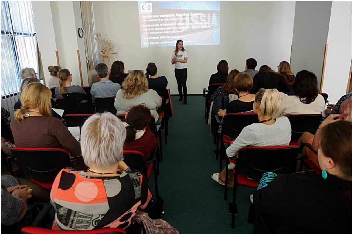
Seminář pro knihovníky Moravskoslezského kraje