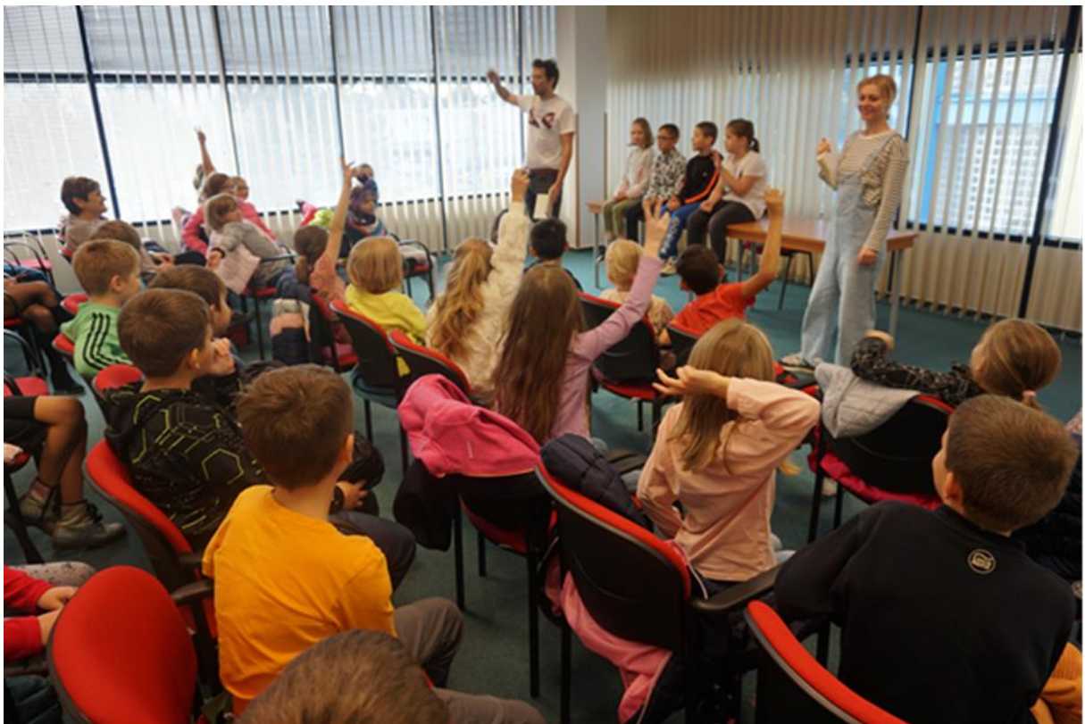
Listování představení Šmodrcha