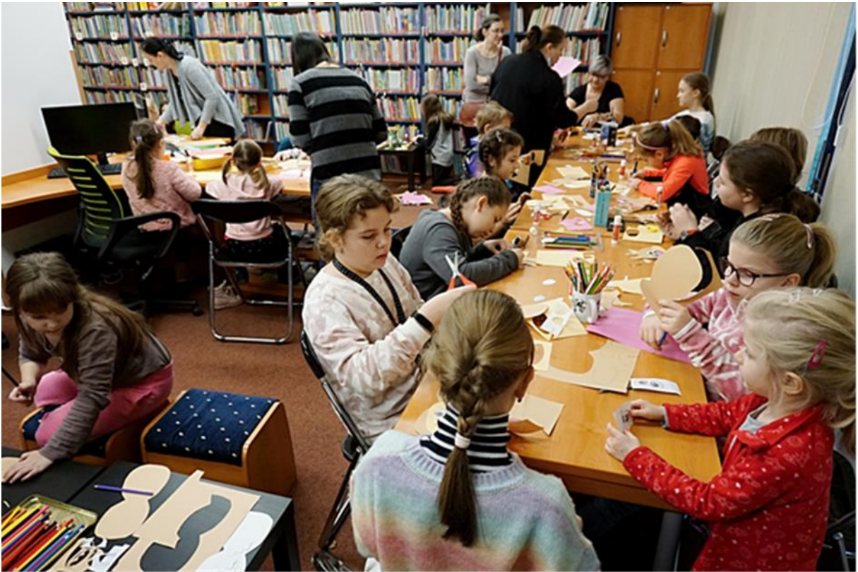
Den pro dětskou knihu